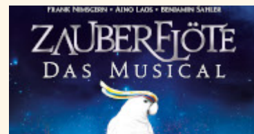
Zauberflöte - das Musical