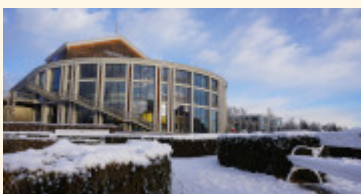
Buchbinder Wanninger - Musical & Menü